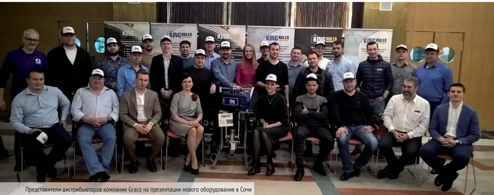
Представители дистрибьюторов компании Graco на презентации нового оборудования в Сочи

«Независимо от выполняемых работ... После установки этих новых уплотнений я ни разу не сталкивался с утечкой из горловины, а ведь я работаю с насосами уже 42 года!»