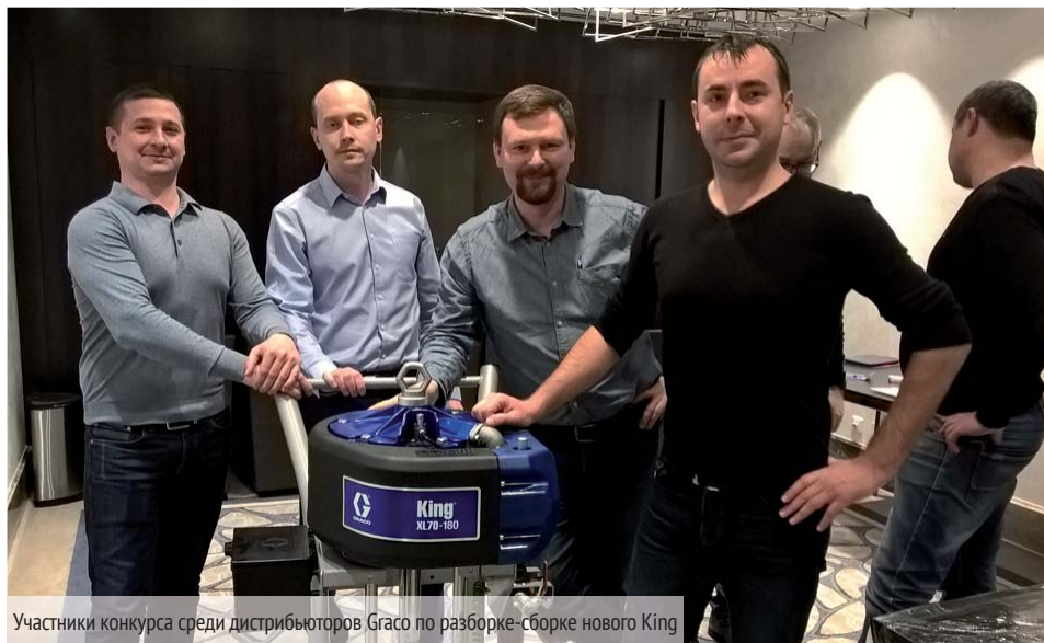
Участники конкурса среди дистрибьюторов Graco по разборке-сборке нового King

Дополнительная информация на сайте Graco: www.graco.com/kingrules