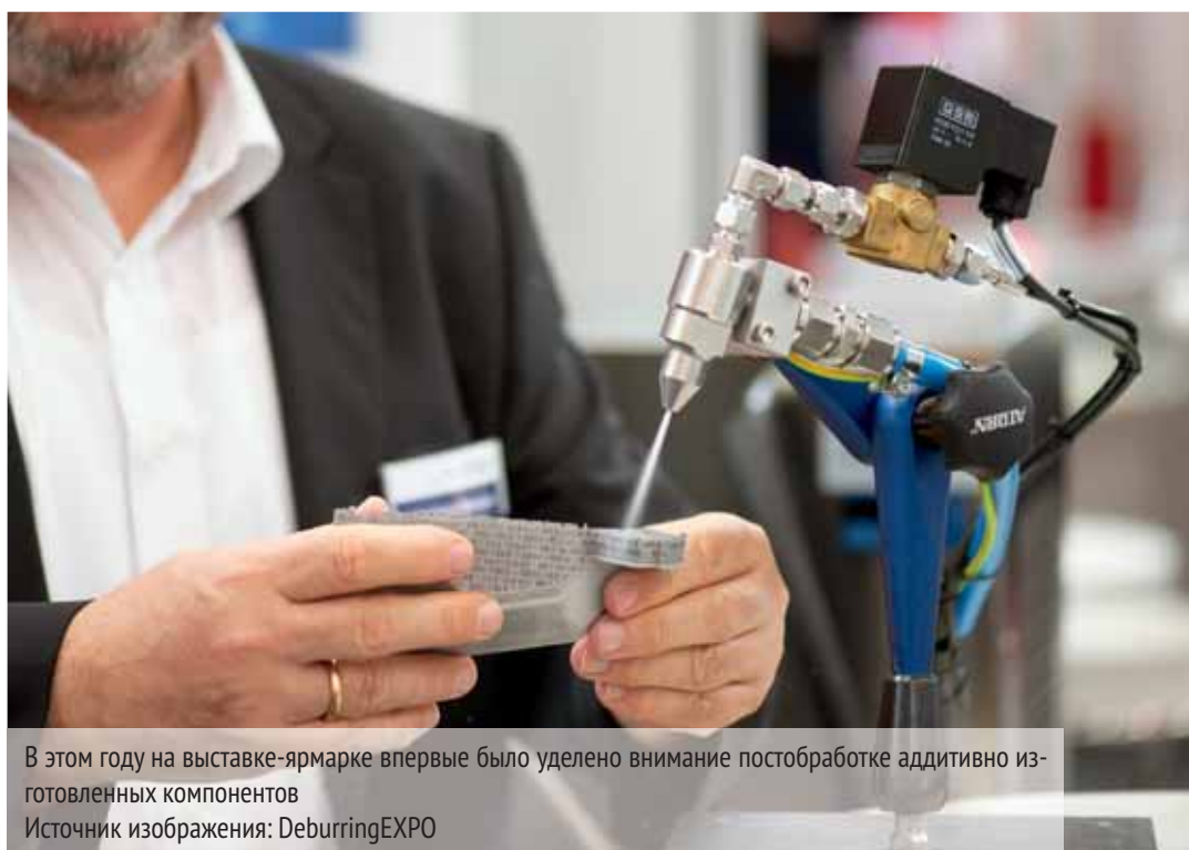
В этом году на выставке-ярмарке впервые было уделено внимание постобработке аддитивно изготовленных компонентов

По мнению участников выставки, в последние годы наблюдается тенденция по